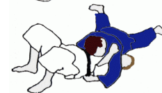
Kami-shiho-gatame (beide Ausführungen möglich)